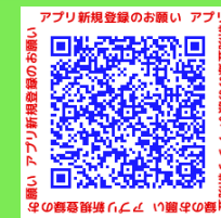
アプリ新規登録のお願い アプリ