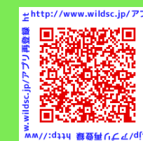
http://www.wildsc.jp/アプリ再登録のお願い