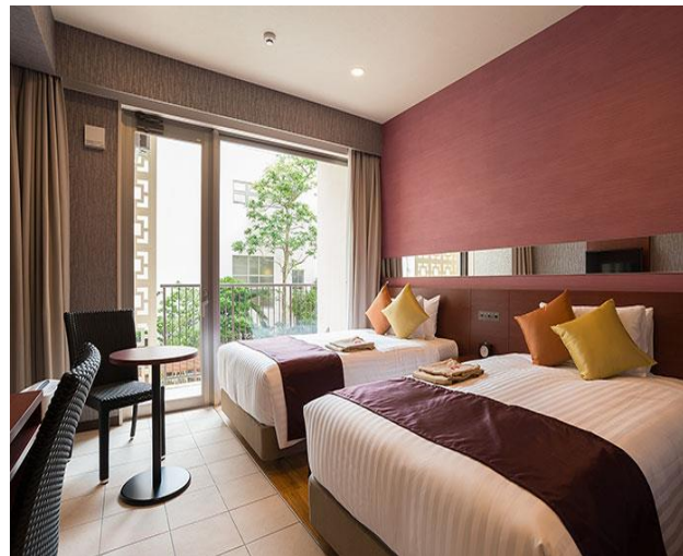
※写真は全てイメージです